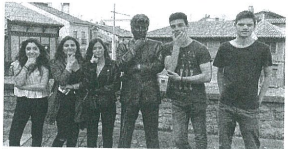
Grupo de Albergaria-a-Velha em Estágio Erasmus no País Basco

Por fim, posso referir que o ambiente vivido por todos nós, o grupo de Albergaria que foi para Bilbao, foi muito agradável, tomando, assim, esta experiência ainda mais inesquecível! Gostaria de agradecer a todos por me terem dado a oportunidade de vivenciar esta experiência única na minha vida!