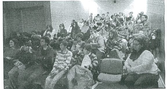
Alunos da E.B. João Afonso de Aveiro, Auditório IPDJ Aveiro

da KonstantDrems - Fashion Accessories. Assistiu-se a uma sessão de partilha de saberes e experiência na área, que visou sensibilizar os jovens para a importância da Engenharia na vida da sociedade e do mundo, sobre os desafios e oportunidades de carreira nesta área e, simultaneamente, atrair mais raparigas para cursos.