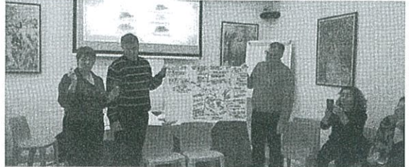
personalidade, Enneagrama, cada um conseguiu evidenciar ao longo dos trabalhos da semana, refletindo sobre as atitudes e comportamentos evidenciados ao longo dos trabalhos da semana.

O principal objetivo foi promover o conhecimento e experiência entre os diversos participantes e adoção das melhores estratégias para a resolução de situações-problema / desafios atendendo à personalidade de cada um. Com a dinamização de grupos foi possível ao formador avaliar o comportamento individual e, após a elaboração do teste dos 9 tipos de